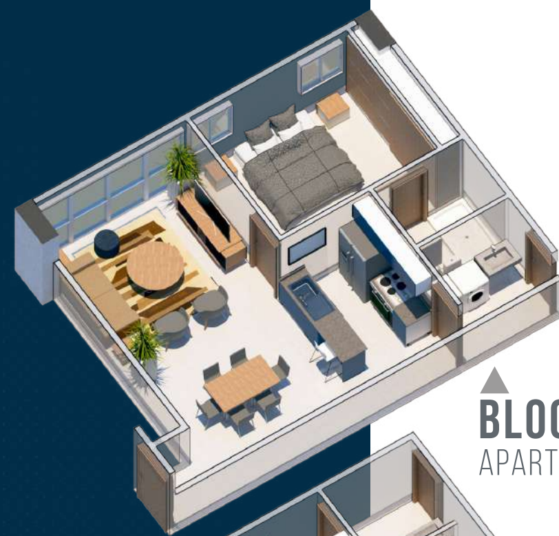
BLOQUE C APARTAMENTO 60 MT 2