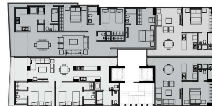
BLOQUE B APARTAMENTO 100 MT 2