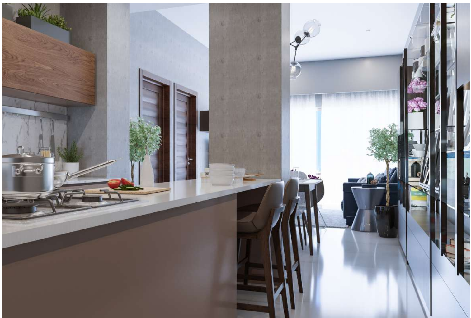
Imagen Superior: Desayunador Cocina. Imagen Derecha: Vista Habitación Principal.