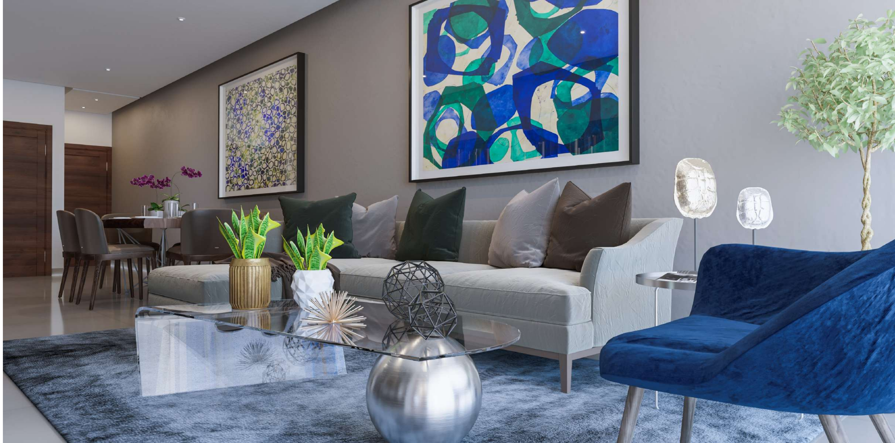
Imagen Derecha: Vista Sala-Comedor

Sin duda un espacio para disfrutar y vivir con la mayor comodidad.