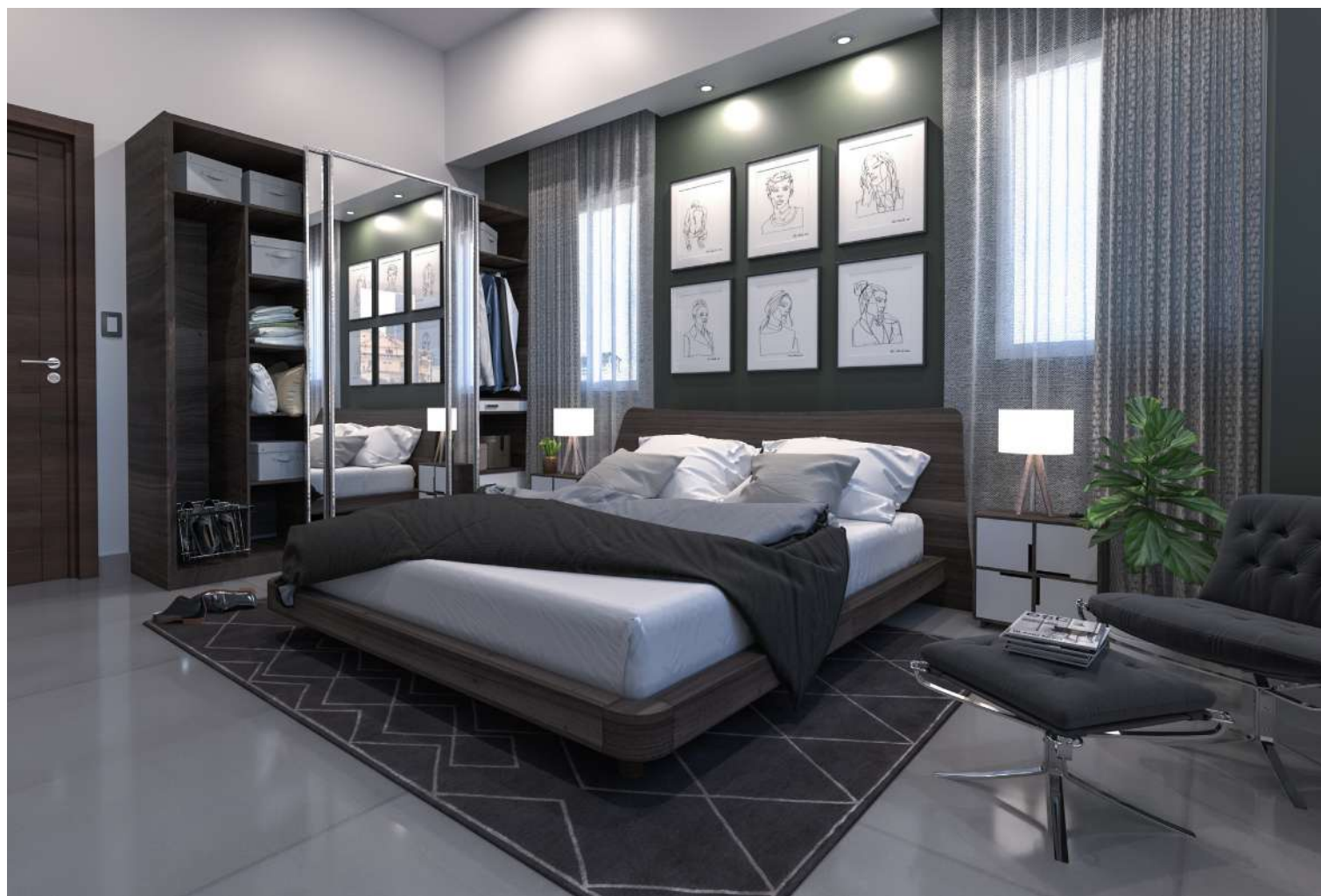
Imagen Superior: Habitación Principal Imagen Izquierda: Vista Cocina