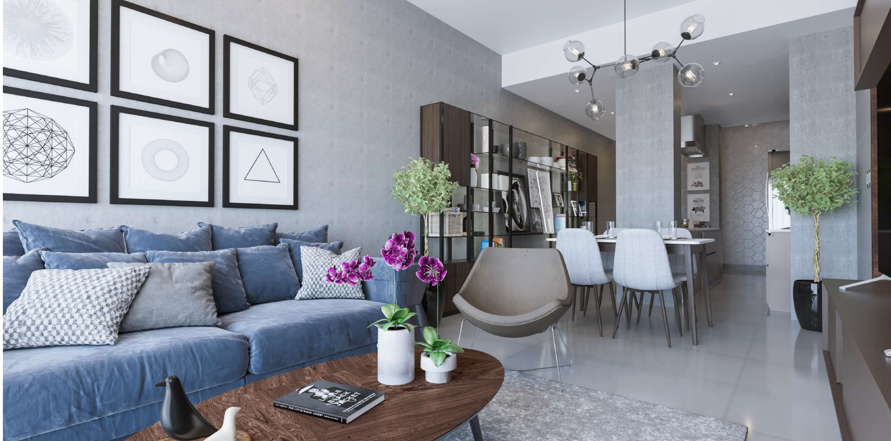
Imagen Derecha: Vista Sala - Comedor.

Culminando en un balcón que plasma a modo de bastidor, una vista impecable del sur de la ciudad. Decorando y abriendo al exterior los espacios sociales del apartamento