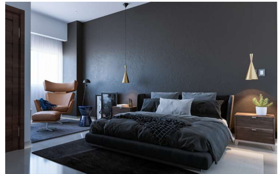
Imagen Superior: Vista Cocina Imagen Inferior: Vista Habitación Principal Imagen Izquierda: Vista Comedor